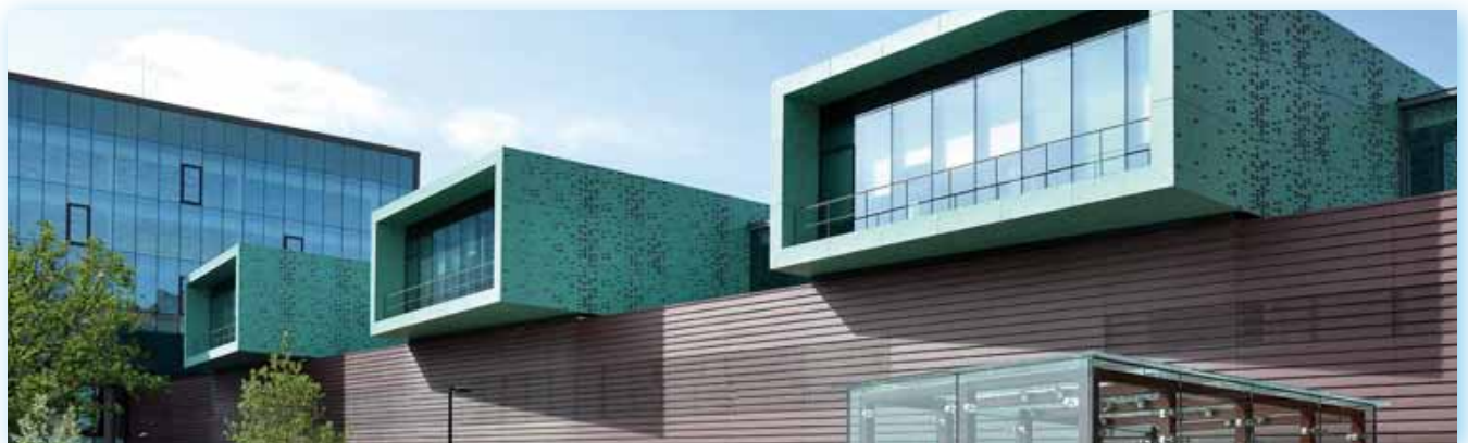
Siège Crédit agricole 35

Basé à Rennes, présent sur le Grand Ouest et l'Île de France, OMS peut intervenir autant sur des réalisations neuves qu'en réhabilitation.