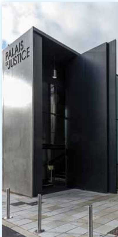
Palais de Justice de Vannes