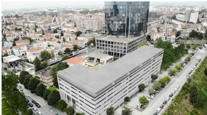
Projet Antasbuild – Porto (Portugal) / ©Groupe Legendre - JBMM Arquitetos

Le Groupe Legendre, qui totalise désormais une quarantaine de collaborateurs sur ses 3 agences situées à l'étranger, compte plusieurs chantiers en cours de réalisation. En plein cœur de Londres, les équipes anglaises du Groupe mènent actuellement deux projets de construction. La société réalise également un complexe immobilier sur le port de Saint-Hélier, au sud de l'île anglo-normande de Jersey. Celui-ci comprendra 280 appartements et penthouses répartis sur trois bâtiments, 150 m 2 de bureaux, 1800 m 2 d'espaces commerciaux et plus de 200 places de parking.