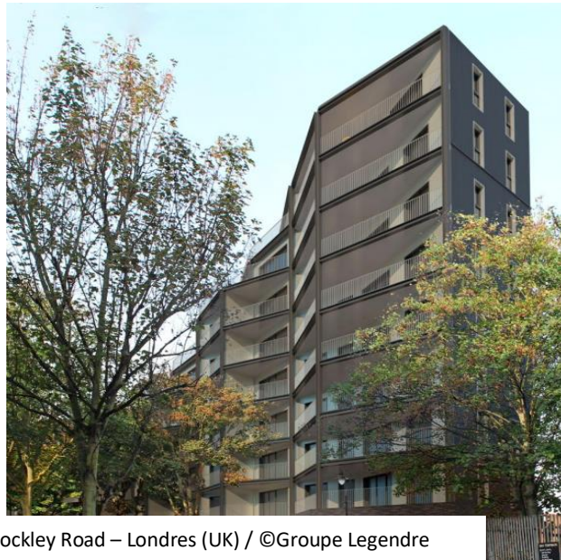
Projets Parker Tower et Dockley Road – Londres (UK)