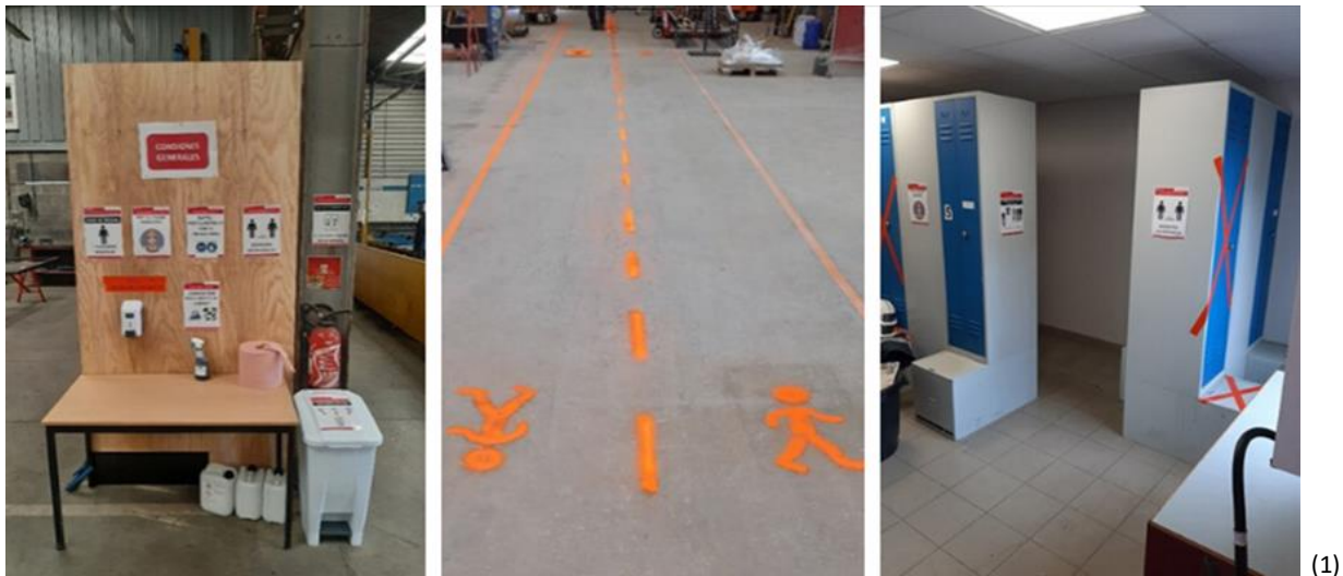
Exemples de mesures mises en place dans les parcs matériels (1) et l'agence parisienne Heron (2) du Groupe Legendre