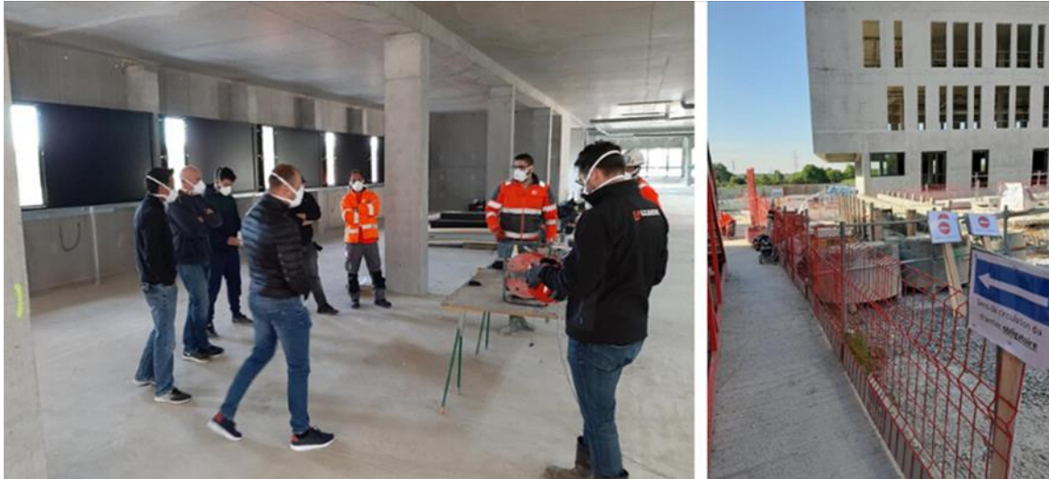
Sunset à Rennes (35) est un des premiers chantiers à avoir repris mi-avril dernier

Depuis le 14 avril dernier, le Groupe Legendre a entamé le redémarrage de ses chantiers en construction. Si quelques activités de la société n'avaient pas pleinement cessé pendant le confinement telles que la conception de certains projets immobiliers ainsi que la maintenance préventive et curative, tous les chantiers avaient, eux, été complètement arrêtés depuis le 17 mars et les agences fermées depuis le 20 mars. La reprise des activités construction du Groupe et la réouverture des bureaux sont aujourd'hui bien en ordre de marche, une reprise progressive qui devrait permettre d'atteindre 80% de l'activité d'ici la fin du mois de mai.