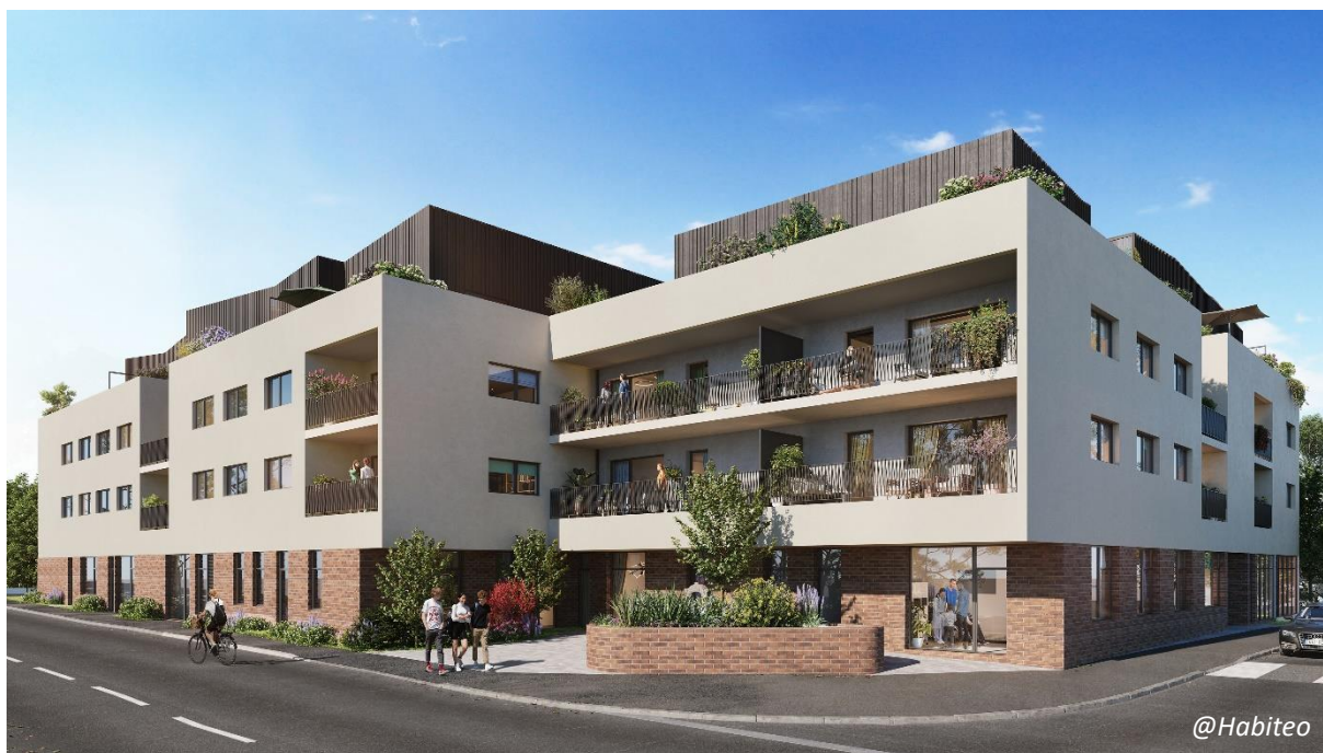
Résidence Terra Rossa – Legendre Immobilier (maitre d'ouvrage) – Agence UNITE (architecte)

Le 1 er avril 2022, LEGENDRE IMMOBILIER débutera la commercialisation de son nouveau projet TERRA ROSSA , situé à Chartres de Bretagne. Cet ensemble immobilier proposera 30 logements et un pôle médical en rez-de-chaussée. Imaginé par l'agence d'architecture UNITE , TERRA ROSSA verra le jour au cours du 4 e trimestre 2024.