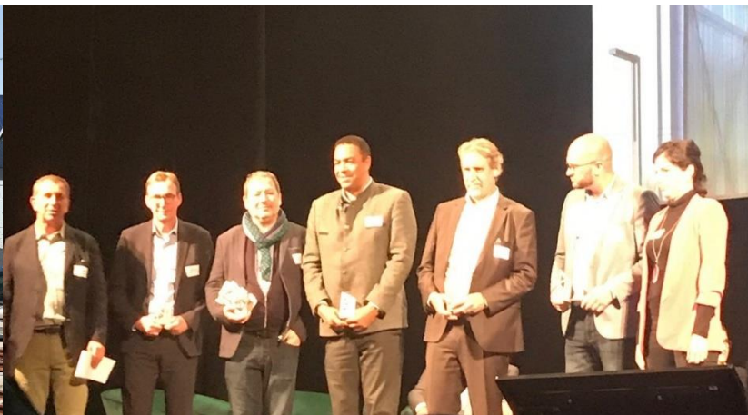
Remise des Prix – Trophées Eiffel 2022

Lors de la Cérémonie des Trophées Eiffel qui s'est déroulée le 6 octobre 2022, au Trianon à Paris (75), OMS s'est vu remettre le Trophée Eiffel dans la catégorie « Voyager » pour l'étude d'exécution, la fabrication et la pose de la charpente métallique du Centre de maintenance et de remisage du Tramway T9, à Orly (94), en partenariat avec Renaudat Centre Construction. Organisé par le réseau Construire Acier, ce concours national récompense des œuvres architecturales réalisées, pour tout ou partie, grâce au matériau acier. Le jury, présidé cette année par l'architecte Manuelle Gautrand, a été séduit par la mise en valeur du métal dans l'architecture de cet équipement industriel réalisé pour le compte d'Île-de-France Mobilités et imaginé par le cabinet Ferrier Marchetti Studio. Grâce au travail minutieux des constructeurs métalliques, la silhouette de ce bâtiment se distingue par la finesse de ses lignes géométriques et par l'utilisation quasi exclusive de l'acier, du bardage jusqu'à la couverture.