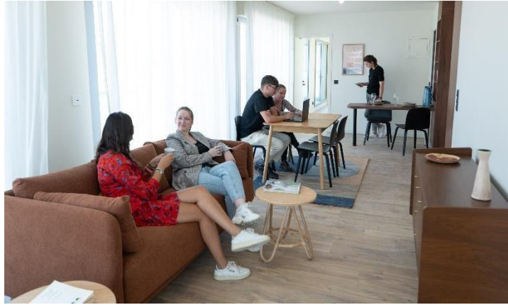
Rennes - WHOO Rennes Gare - LXP - @GiveProd

En lançant sa marque WHOO en 2017, LEGENDRE XP, filiale du GROUPE LEGENDRE dédiée à l'exploitation, a investi le marché dynamique de la résidence urbaine, apportant une réponse globale aux nouvelles tendances du logement, à l'attention des jeunes actifs, étudiants et professionnels.