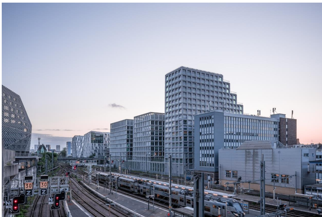
Beaumont - Rennes / Atelier Kempe Thill et Atelier 56S