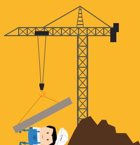
ELINGAGE ET LEVAGE