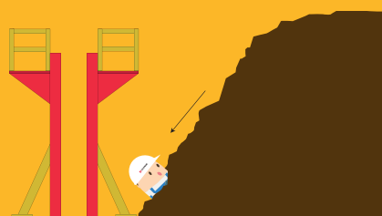
ENSEVELISSEMENT OU EFFONDREMENT