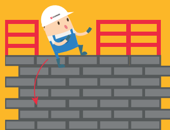
CHUTE DE HAUTEUR